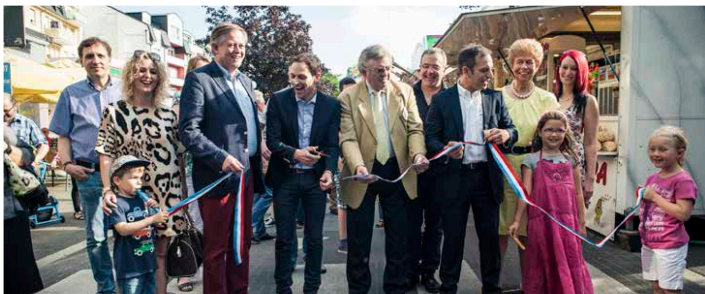
Ouverture Summerkiermes - 26.06.2015