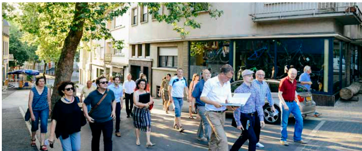
Visite 'Patrimoine bâti et PAG' avec le Service des Sites et Monuments nationaux - 16.07.2015