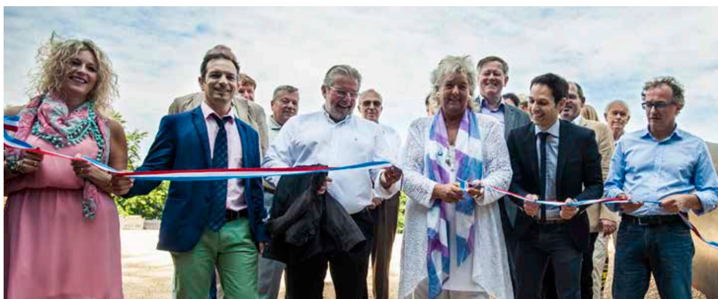
Inauguration du site réaménagé au Mont St-Jean - 23.07.2015