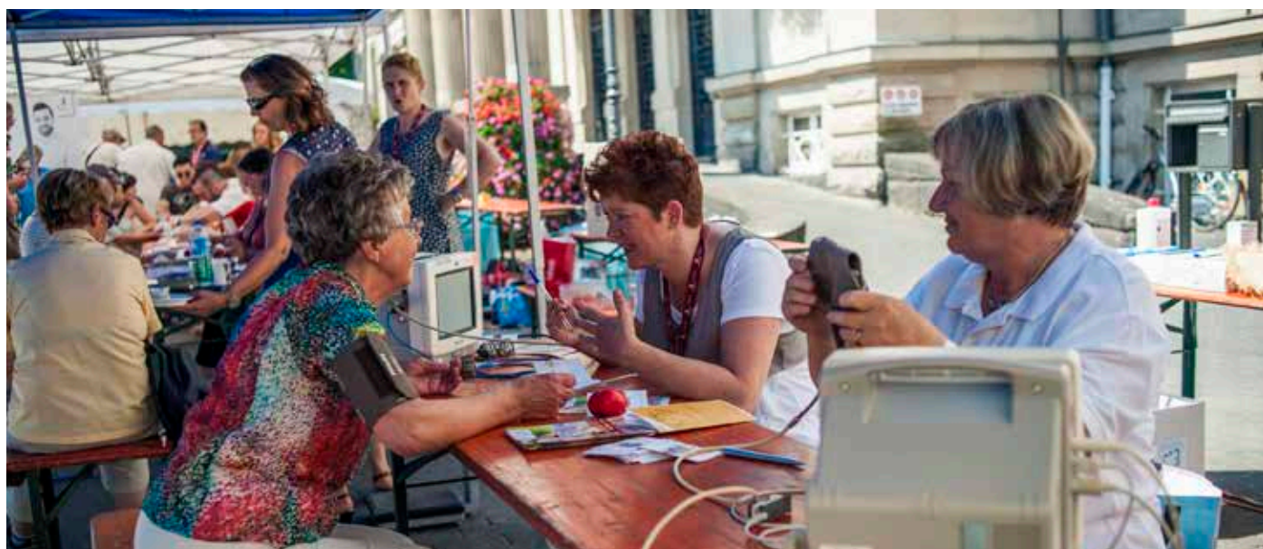
Journée de la Santé - Ouverture en présence de la ministre de la Santé, Lydia Mutsch - 04.07.2015