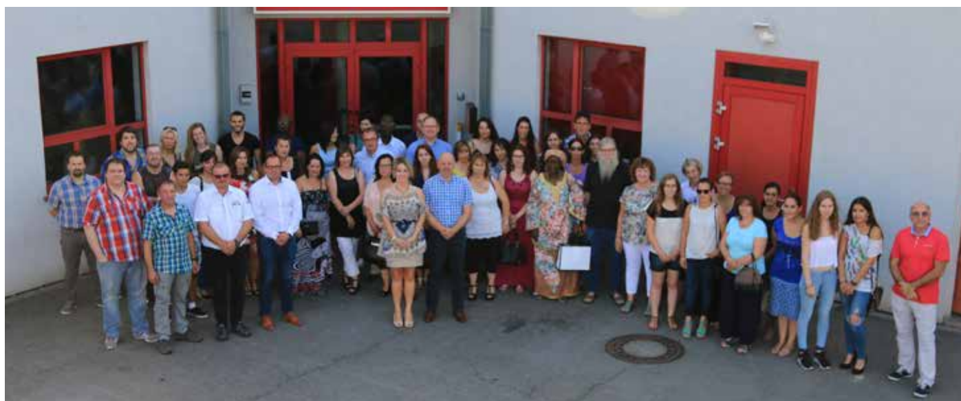
Remise des diplômes CID - 16.07.2015