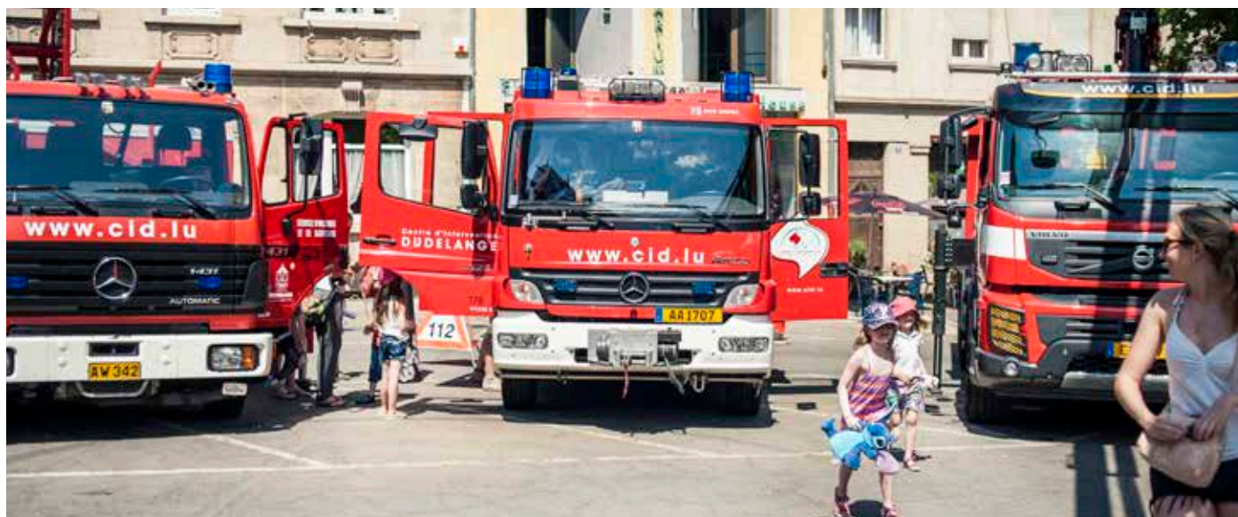
Demo Day - 04.07.2015