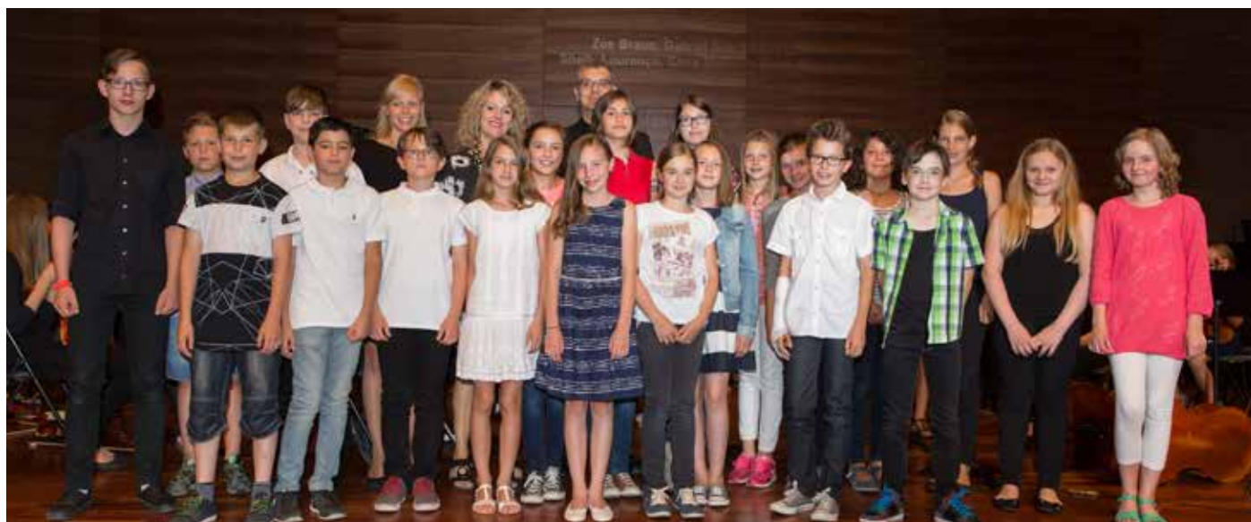
Remise des diplômes Ecole de musique - 15.07.2015