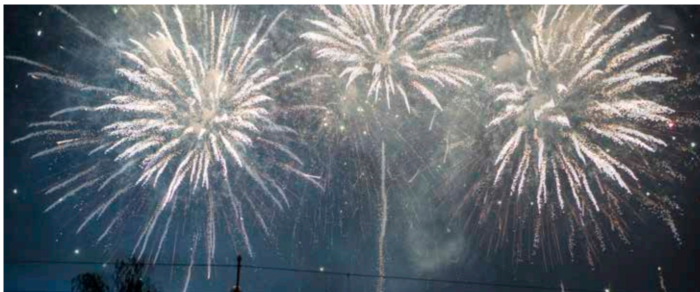
Fête nationale - 23.06.2015