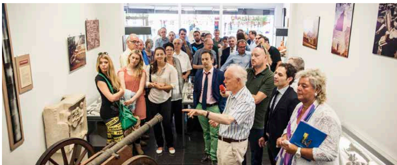
Inauguration du nouveau musée municipal en présence de la ministre de la Culture, Maggy Nagel - 23.07.2015